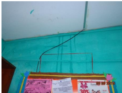
Wasserspuren an den Bürowänden