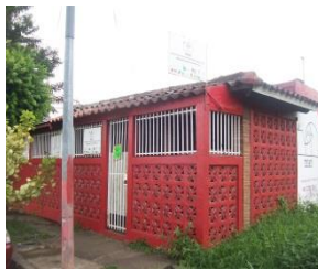
MIRIAM-Haus in Managua