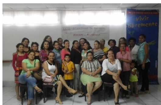
Vereinsfrauen von MIRIAM auf der Mitgliederversammlung im September 2015

Nach ihrem Studium sind weiterhin viele der Stipendiatinnen zum Beispiel als Koordinatorinnen, Anwältinnen oder Sozialpädagoginnen bei MIRIAM und anderen NGOs haupt- oder ehrenamtlich tätig. Einige der aktuellen und ehemaligen Stipendiatinnen traf ich auf der Mitgliederversammlung von MIRIAM wieder. Die Versammlung fand am Wochenende vor dem Internationalen Tag gegen Menschenhandel statt, daher bildete ein Kurzvideo gegen Menschenhandel den Auftakt des ganztägigen Treffens der Vereinsfrauen.