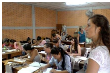
Theorieunterricht im Schneiderkurs