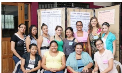
Mit Teilnehmerinnen des Projekts „Cambio“