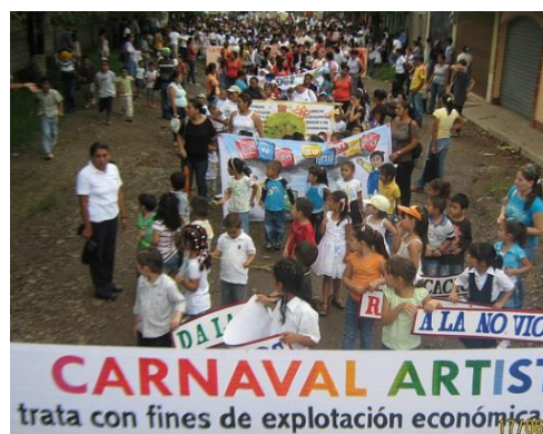
Demonstration nicaraguanischer Kinder gegen sexuelle Ausbeutung