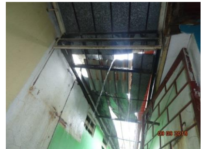
Regen läuft direkt durch das Dach