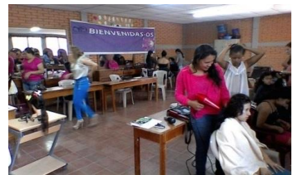
Praxisunterricht im Frisierkurs