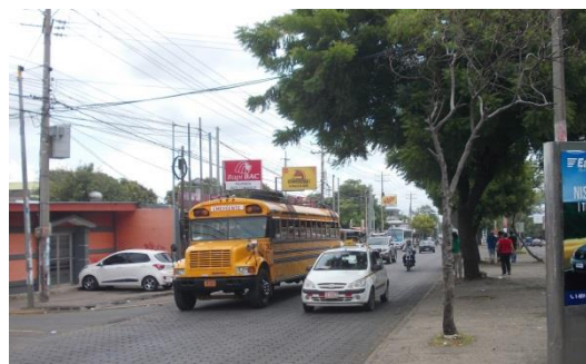
Schulbus aus den USA in Managua

Während meines Aufenthalts in Nicaragua pendelte ich zwischen den beiden MIRIAM-Standorten Managua und Estelí – je nachdem, wo die Treffen und Projektaktivitäten stattfanden. Die Hauptstadt beheimatet mehr als 1 Million Menschen, rund ein Fünftel der Gesamtbevölkerung Nicaraguas. Die im Norden gelegene Kleinstadt Estelí und die ihr zugeordneten ländlichen Gemeinden zählen 118.000 Einwohner. Von Managua ist das 145 km entfernte Estelí mit dem öffentlichen Bus, oft ein ausrangierter US-amerikanischer Schulbus, in drei Stunden zu erreichen.