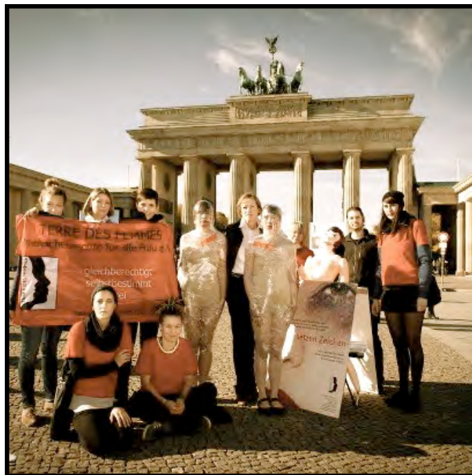
Kampagnenstart am 18.10.2012 vor dem Brandenburger Tor

18. - 30. Oktober 2012 & 28. Januar - 1. Februar 2013