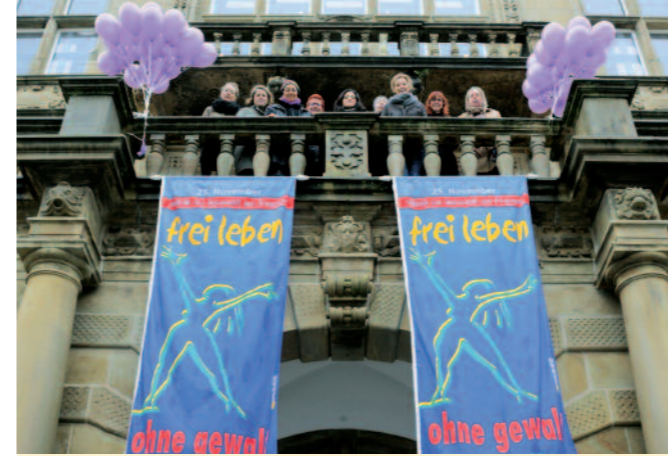
In Bielefeld hingen am 25. November 2015 gleich zwei Fahnen am Rathaus.

Wir klären auf, wo Traditionen Frauen das Leben schwer machen, protestieren, wenn Rechte beschnitten werden und fordern eine lebenswerte Welt für alle Mädchen und Frauen – gleichberechtigt, selbstbestimmt und frei!