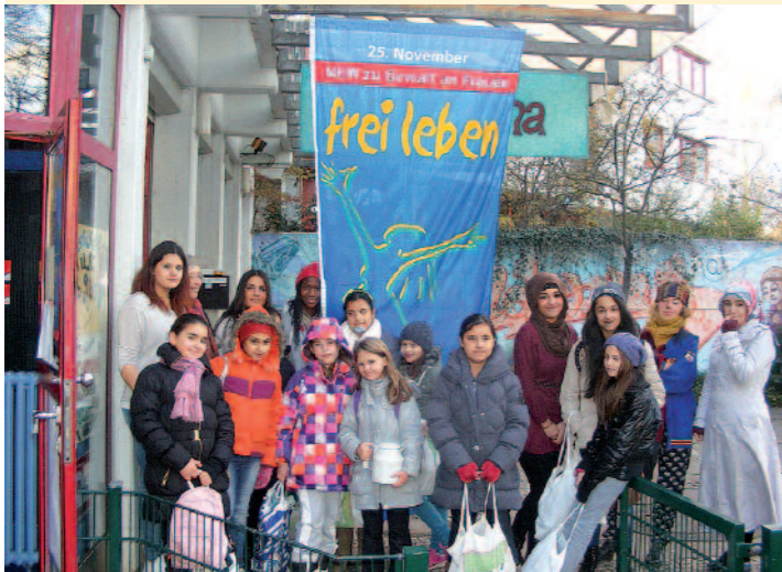
Auch die Mädchen des MaDonna Mädchenkult.Ur e.V. setzten 2015 ein Zeichen gegen Gewalt in Berlin.

Solidarisch demonstrieren Frauen und Männer von Berlin über Honduras bis nach Burkina Faso gegen Gewalt an Mädchen und Frauen. Sie alle zeigen mit ihrem Engagement, dass dieses Thema keine Grenzen kennt und setzen mit der „frei leben – ohne Gewalt“-Fahne ein weithin sichtbares Zeichen.