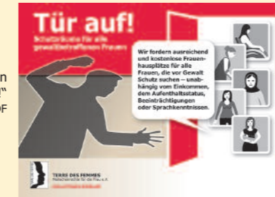
Plakat zur diesjährigen Fahnenaktion „Tür auf!“

In Deutschland gibt es knapp 400 Frauenhäuser und Zufluchtswohnungen für von Gewalt betroffene Frauen und ihre Kinder, doch es gibt zu wenige und diese sind nicht ausreichend finanziert. So können häufig nicht alle Frauen, die einen Platz suchen, aufgenommen werden. Viele der Häuser sind zum Beispiel nicht barrierefrei, es fehlt an genügend spezialisiertem Personal oder schlicht und einfach an der Kostenübernahme. Tausende schutzsuchende Frauen müssen jährlich abgewiesen werden.