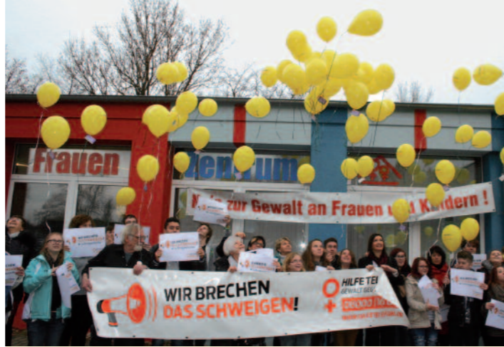
2015 wurden 100 Luftballons von TERRE DES FEMMES von dem Frauenhaus Bitterfeld-Wolfen und dem Frauenzentrum Wolfen fliegen gelassen.